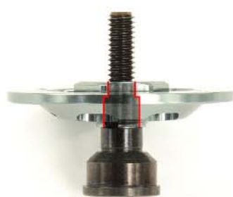
ローター内側断面形状

アクスルとローターハブの 接合部クリアランスにこだ わる事により、ブレがなくな り、回転軸が安定し剛性感 アップ！！