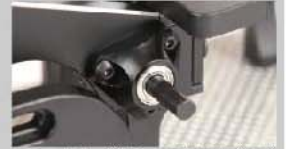
メインギヤシャフトハウジング