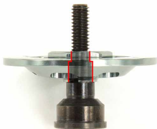
ローター内側断面形状

アクスルとローターハブの接合部クリアランスにこだわる事により ブレがなくなり、回転軸が安定し剛性感アップ！！